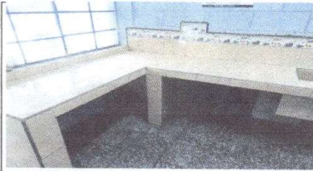
Foto 9: incluye fundición de un planchon de concreto para mesa de cocina