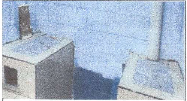
Foto 8: Sustitución de estufa rural (completa) incluye chimenea y plancha de metal