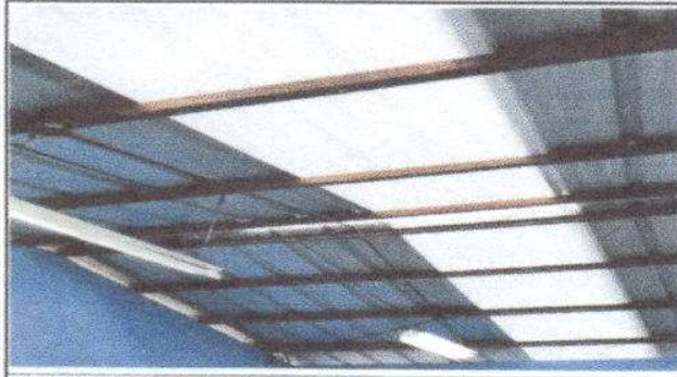
Foto 1: Sustitución de Lamina por lamina troquelada aluzinc Calibre 26